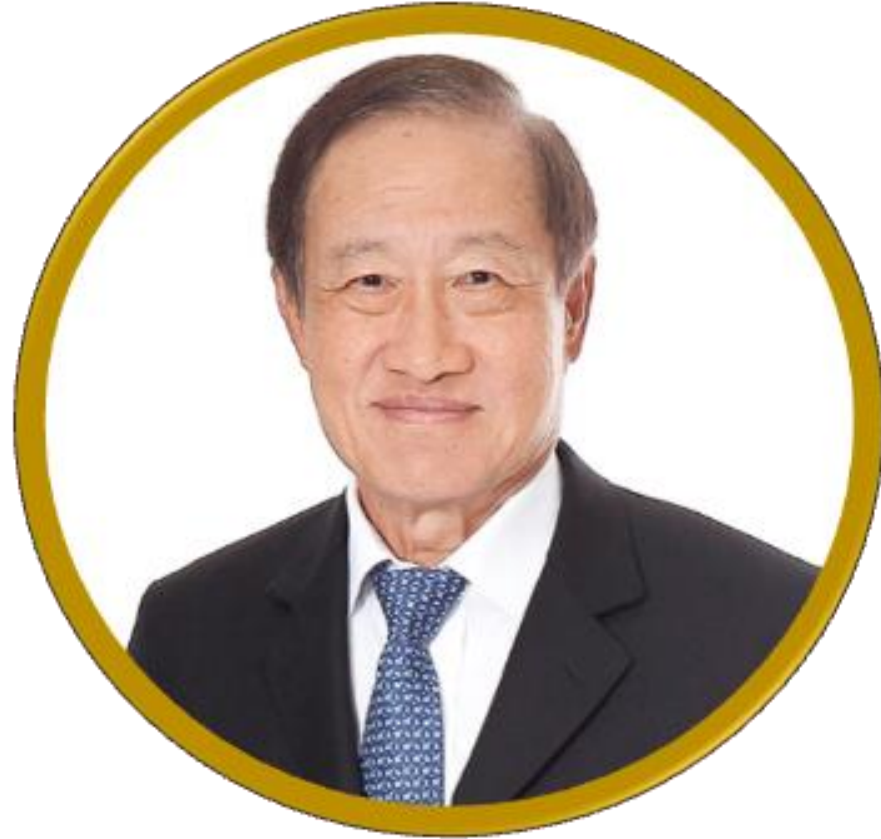
主席 巴育.玛哈吉诗丽先生