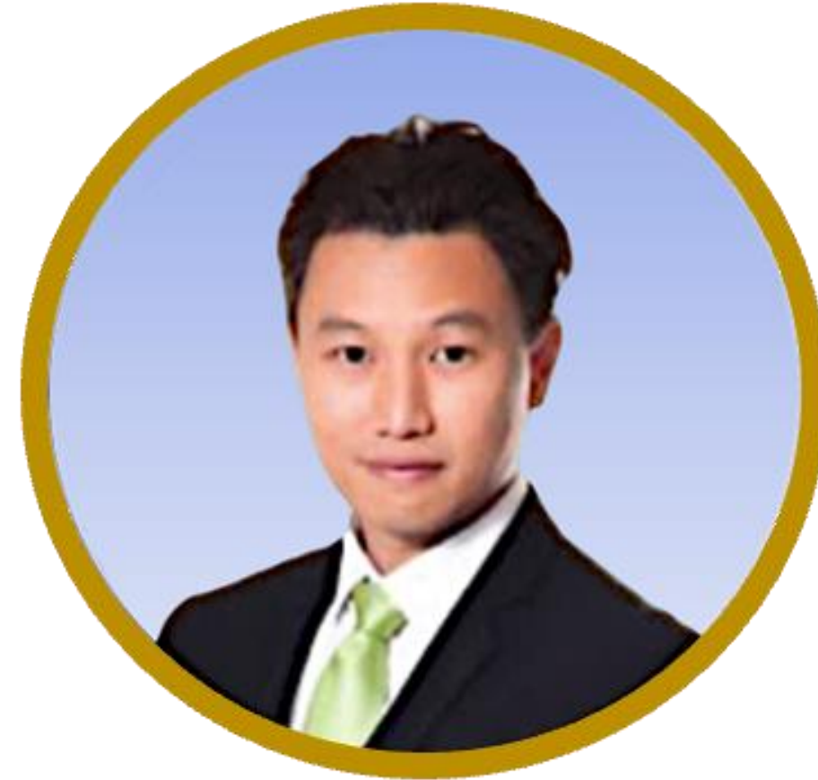
首席执行官 查勒猜.玛哈吉诗丽先生